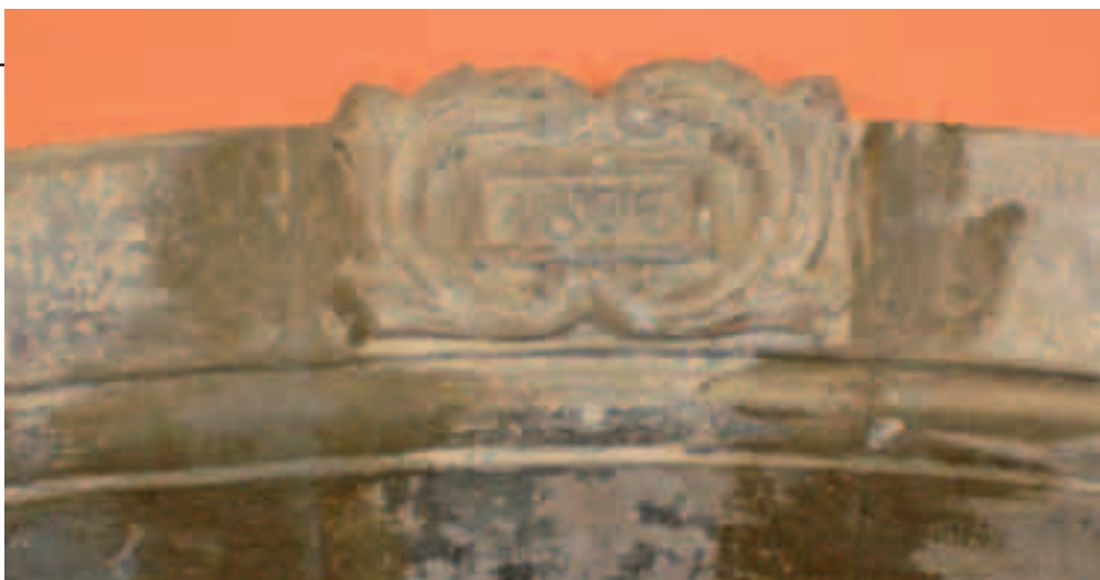
A la llinda que hi ha sobre la portada hi ha esculpit l'any 1806.